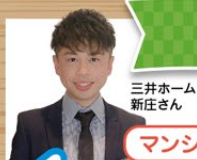
三井ホーム 新任さん